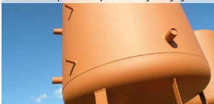
▶ Ceramic-Polymer KTW-1 passed test series according to DVGW-W270 and warm water up to 60 °C – only available in English language