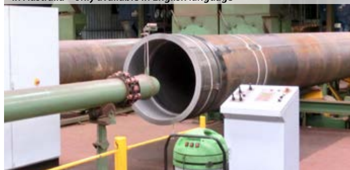
▶ Internal coating of cooling water intake risers for extensive FLNG-Project in Australia – only available in English language