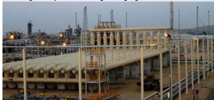
▶ Internal coating of slug catcher pipelines for the extraction of natural gas – only available in English language