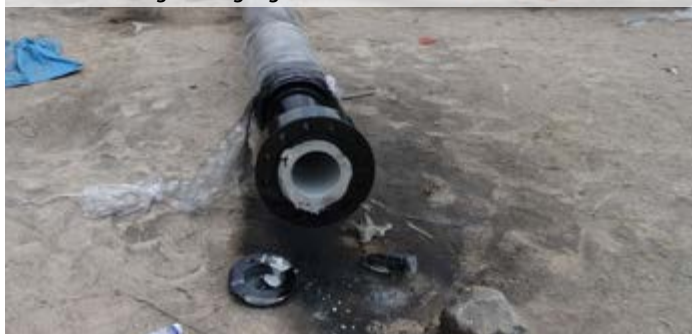
▶ Internal coating of pipelines for high-temperature crude oil (80 °C) – only available in English language