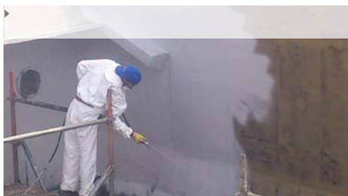
▶ Internal coating of slug catcher pipelines for the extraction of natural gas – only available in English language