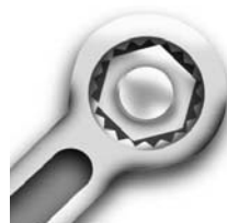
Špeciality pre údržbu