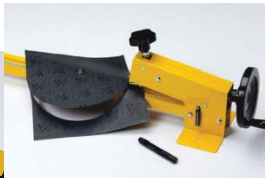
Rezač tesení ADW LT1250

Pre vyrezávanie plochých doskových tesení